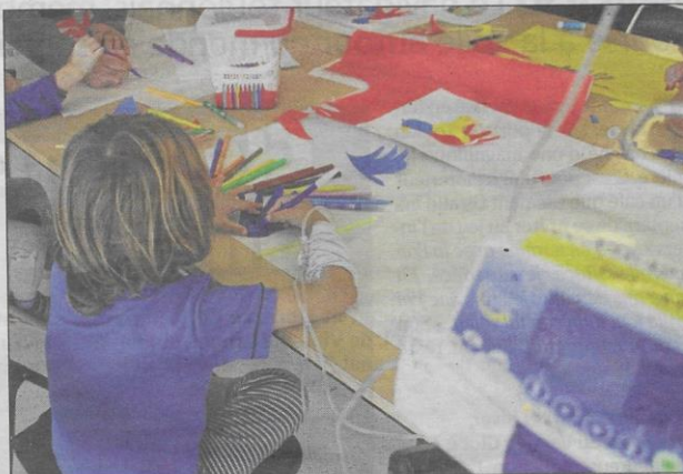
Du matériel de dessin a notamment été offert aux enfants hospitalisés grâce aux actions de La Cour des miracles.